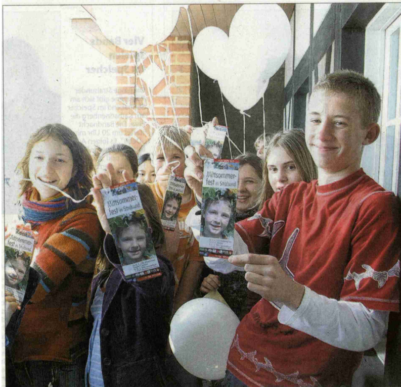
Vom Turm des Hansa-Gymnasiums schickten gestern Mädchen und Jungen der 6b Luftballons mit Einladungen zum Stralsunder Mittsommerfest am 18. Juni auf die Reise.